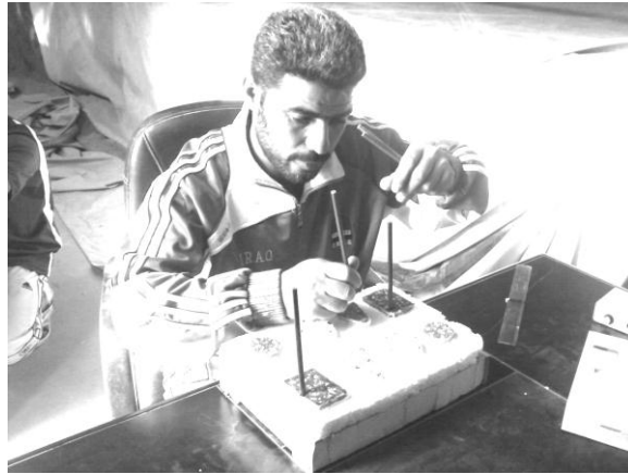
شكل (٣) يوضح الاختبار في جهاز الاشكال الهندسية

- تسجيل الدرجات : يسجل للمختبر الزمن الذي يستغرقه في ملئ اللوحة بالقضبان الخشبية مع ملاحظة ان تكون القضبان موضوعة في مكانها الصحيح تبعاً للونها .