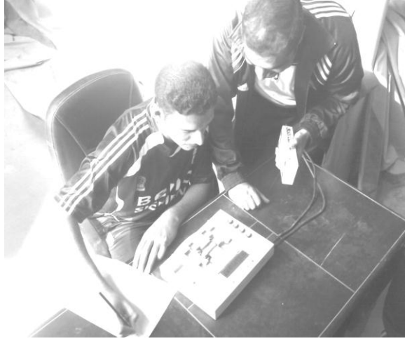
شكل (٥) يوضح اختبار تركيز الانتباه في الجهاز

ب- وعند الانتهاء من اختبار تركيز الانتباه واعطاء المختبر فترة راحة قياسية يتم اختبار سرعة زمن الرجوع لليد كما يلي :