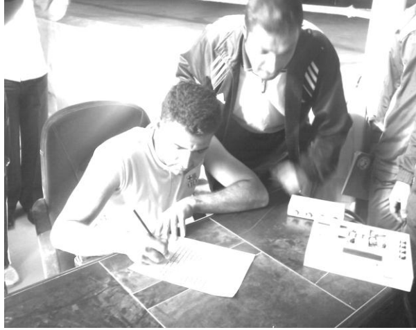
شكل (٤) يوضح اختبار شبكة تركيز الانتباه

التركيز وعمل نسخ متعددة منها حتى لا يتعودون الاعبون على حفظ وتذكر مكان الارقام ، كما موضح بالشكل (٤).