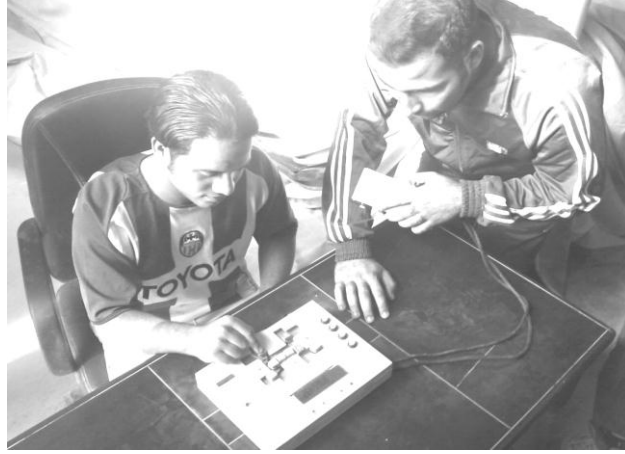
شكل (٧) يوضح اختبار التوافق بين اليد والجهاز والعين

- التسجيل : يتم تسجيل الوقت للاداء الصحيح وبدون اخطاء .