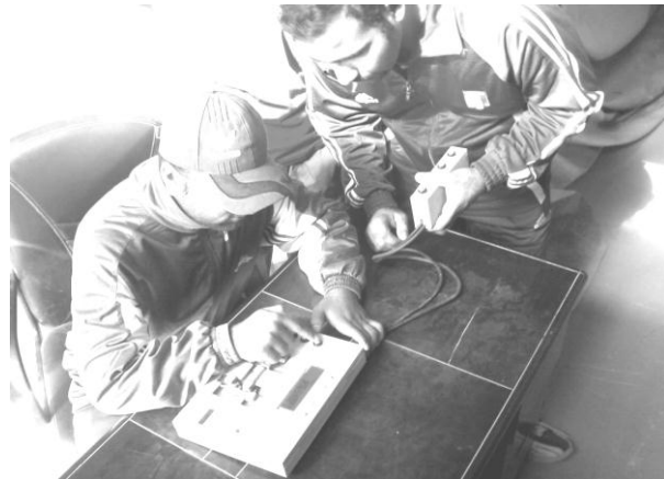
شكل (٦) يوضح اختبار سرعة زمن الرجوع في الجهاز

- التسجيل : يتم تسجيل الوقت من لحظة بدأ المثير ( انارة الضوء ) وعند ضغط المختبر على زر للون نفسه .